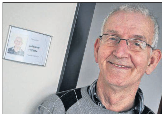
Ein Merkmal der Individualität der Bewohner ist das Namensschild an jedem Apartment. Außerdem besitzt jedes Zimmer eine eigene Tür Klingel.