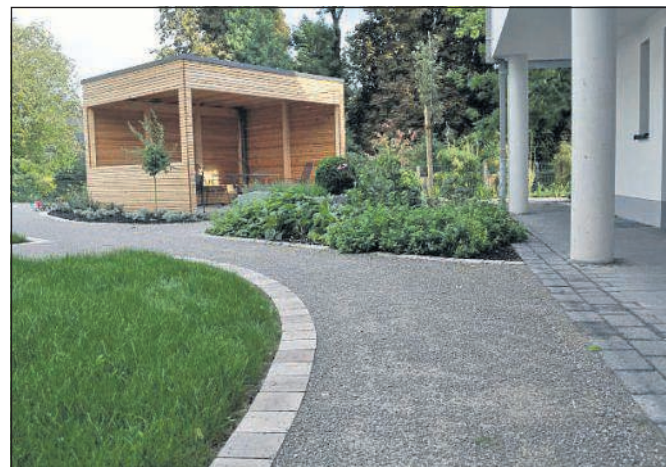
Am neuen Gebäude in der Von-Droste-Straße wurde ein malerischer Sinnesgarten angelegt. Die Gewürze und Pflanzen, die hier wachsen, werden von den Bewohnern und dem Personal des Wohn- hauses beim Kochen verwendet.